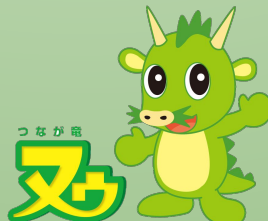
さいたま市PRキャラクター 「つなが竜 ヌウ」