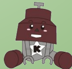
川口市PRキャラクター 「きゅぼらん」